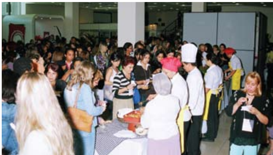
Em razão do sucesso de público do III Fórum, o IV Fórum Nacional de Merenda Escolar também será realizado no Centro de Convenções Frei Caneca. Novamente contaremos com o almoço oferecido pela associada J. Coan.

Mantendo-se a qualidade dos expositores e do conteúdo atualizado, que tem sido a tradição neste tipo de evento, a ABERC está convocando especialistas de renome, que tenham mensagens